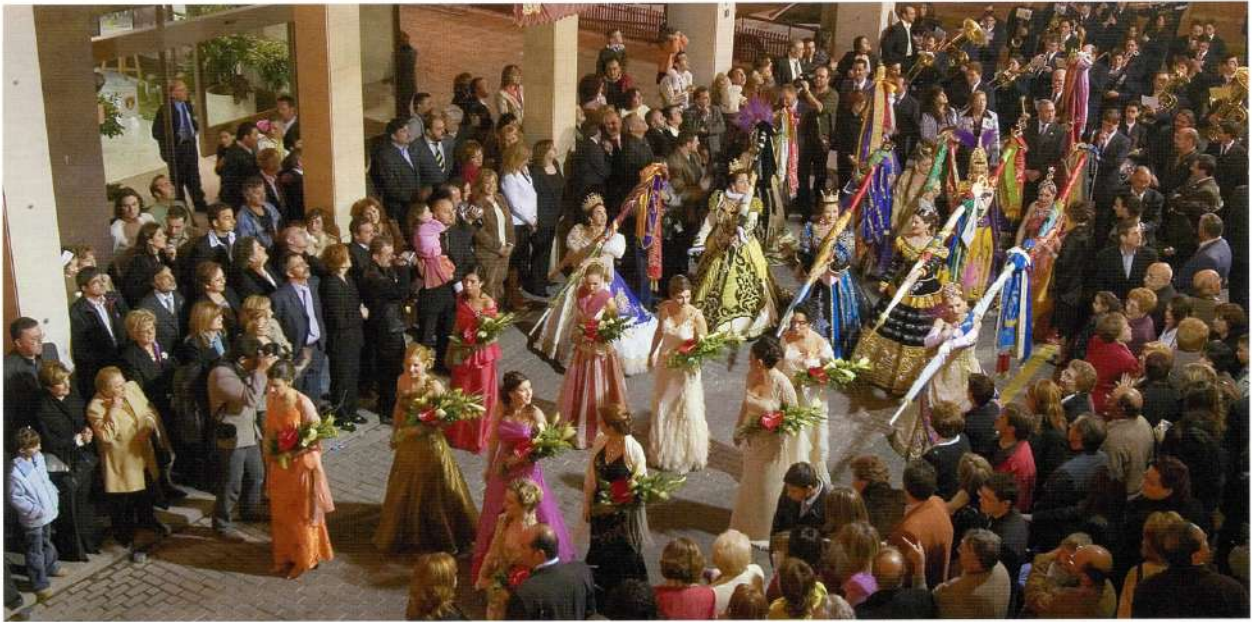
Inicio del pasacalle de bajada hacia el teatro Cervantes. Desde hace años la noche del pregón se ha convertido en la puesta de largo de nuestras abanderadas.

pregonero. Curiosamente, es a partir de 1990, cuando se invierte la tendencia que había hasta entonces y los petrerenses comienzan a ser nombrados pregoneros con mayor frecuencia, siendo 9 los que desde dicho año y hasta el actual asumen tan alta responsabilidad. Por cierto que tres de ellos, lo han sido consecutivamente en los tres últimos años.